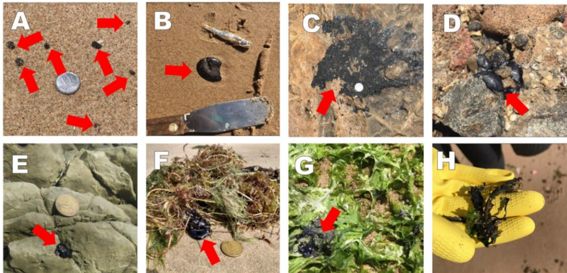
Figura 2: Registros do impacto agudo na Praia da Pituba em Salvador, BA, no dia 09 de novembro de 2019: A – pequenas pelotas na areia; B – fragmento de cerca de 5 cm de diâmetro; C – mancha grande incrustada em superfície de rocha; D e E – manchas de diferentes dimensões entre fendas de rochas. F, G e H – óleo encontrado contaminando algas.

No que concerne à fauna, foram identificadas quatro espécies de Porifera e quatro de Cnidaria distribuídas nas seguintes categorias taxonômicas: