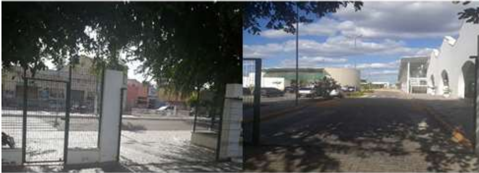
Figura 1: Entrada do campus.

Conforme estabelecido pela ABNT [15], “todas as entradas, bem como as rotas de interligação às funções do edifício, devem ser acessíveis” para que as pessoas com deficiência possam ter autonomia e segurança durante todo o seu trajeto nas instituições de ensino, por exemplo. Na instituição pesquisada, a entrada principal possui a calçada rebaixada, no entanto, a entrada para pedestres é estreita e encontra-se ao lado da entrada de automóveis podendo ocasionar acidentes para as pessoas cegas devido a inexistência de sinalização audiovisual. O estacionamento, por sua vez, encontra-se logo à frente da entrada, cuja faixa de pedestres apresenta-se em uma rota não acessível conforme verifica-se na Figura 1.