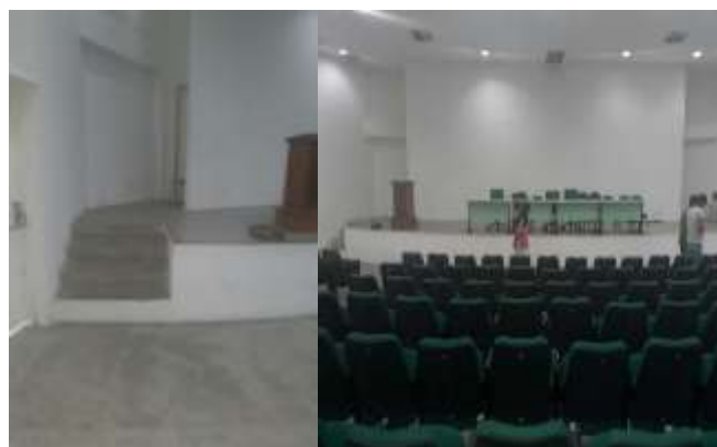
Figura 4: Auditório central do campus.

O auditório da instituição apresenta-se em total discordância com a NBR 9050, sendo explícitos os diversos obstáculos que dificultam a locomoção da pessoa cega. Neste, há ausência de piso tátil, sinalização sonora e tátil, espaços reservados para pessoa com deficiência ou com mobilidade reduzida, rampas para acesso ao palco e corrimão na escada, conforme exposto na Figura 4, revelando um descumprimento da legislação e, também, a (re)produção e manutenção da exclusão institucionalizada.