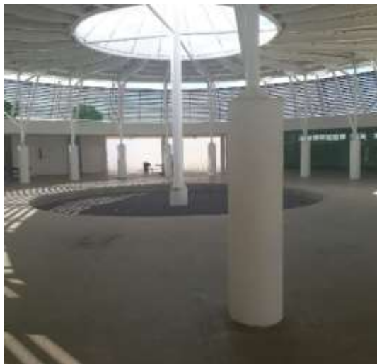
Figura 5: Centro de convivências do campus.

No centro de convivência, além dos problemas já citados, há obstáculos arquitetônicos no piso: um círculo com desnível profundo sem sinalização de alerta dificulta o percurso dos alunos, conforme apontado na Figura 5. Neste espaço deveria existir uma rota acessível, pois “[...] em complexos educacionais e campi universitários, quando existirem equipamentos complementares, como piscinas, livrarias, centros acadêmicos, locais de culto, locais de exposições, praças, locais de hospedagem, ambulatórios, bancos e outros, estes devem ser acessíveis” [15].