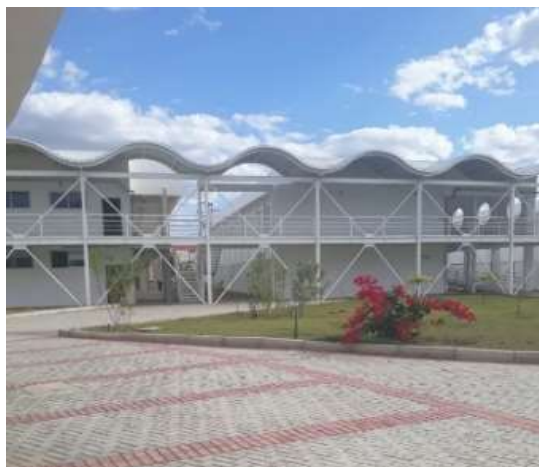
Figura 2: Blocos das salas de aula do campus.

O acesso às salas de aula possui um quantitativo considerável de obstáculos que dificultam a livre circulação dos alunos cegos na instituição, uma vez que nos locais que deveriam possuir rotas de interligação como um corredor, por exemplo, existem escadas suspensas junto à estrutura de ferro com colunas verticais e horizontais, dificultando a locomoção dos alunos em questão, podendo resultar, inclusive, em acidentes graves para estes alunos, conforme verifica-se na Figura 2.