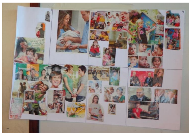
Figura 2: Cartaz confeccionado pelos alunos

Entre as coisas que gostavam estavam as histórias contadas pelos avós e as brincadeiras quase esquecidas, como brincar na chuva, tomar banho de igarapé, pique esconde etc. Já entre seus gostos atuais estavam o interesse pelo sexo alheio, aspirações profissionais e o desejo pela maternidade/paternidade.