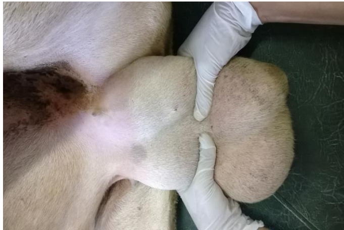
Figura 1: Região do funículo espermático em ambos os cordões espermáticos

Em julho de 2014, foi atendido na Clínica de Ruminantes do Centro de Desenvolvimento da Pecuária (CDP) da EMEVZ-UFBA, um ovino macho, Dorper, com cinco anos de idade, proveniente do município de Entre Rios – BA. Segundo o proprietário o animal manifestou aumento de volume escrotal e emagrecimento progressivo. Ao exame físico geral, verificou-se apatia, caquexia, mucosas oculares esbranquiçadas, linfadenomegalia de linfonodos superficiais (submandibulares e pré-escapulares). No exame físico específico do sistema reprodutor, constatou-se à palpação dos testículos e corpos dos epidídimos, consistência flácida, e os cordões espermáticos apresentavam-se firmes. O animal exibia aumento de tamanho escrotal, cujo diâmetro médio escrotal era de 34 cm. Além disso, a região do funículo espermático encontrava-se aumentada de volume em ambos os cordões espermáticos (Figura 1).