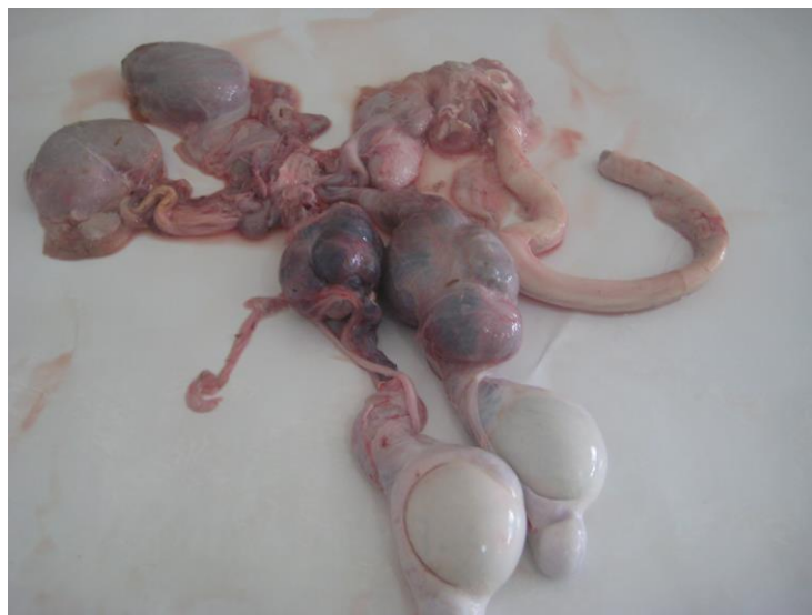
Figura 2: Cordões espermáticos exibindo superfície irregular de aspecto multinodular.

Um dia após o internamento, o animal morreu e foi imediatamente necropsiado. À necropsia, foi observado macroscopicamente, além das alterações observadas ao exame físico específico, atrofia testicular bilateral, os quais exibiam ao corte, superfície compacta de coloração pardacenta com finos feixes de tecido conjuntivo. Os cordões espermáticos mediam 9,4 cm de comprimento, 6,2 cm de largura e 4,4 cm de altura, exibindo superfície irregular de aspecto multinodular. Ao corte, apresentavam consistência firme, superfície compacta de aspecto laminar de coloração vermelho enegrecida (Figura 2).