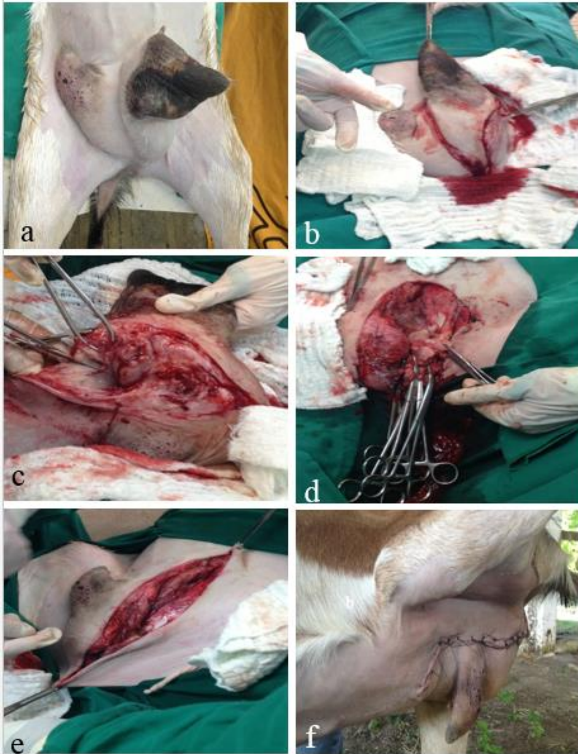
Figura 2: (a) Glândula tricotomyada no pré-cirúrgico, (b) incisão elíptica na glândula acometida, (c) divulsão do parênquima mamário, (d) pinçamento e ligadura das artéria e veia pudenda externa, assim como grandes vasos presentes na região, (e) redução do espaço morto, (f) sutura pós-cirúrgica com o animal em estação.