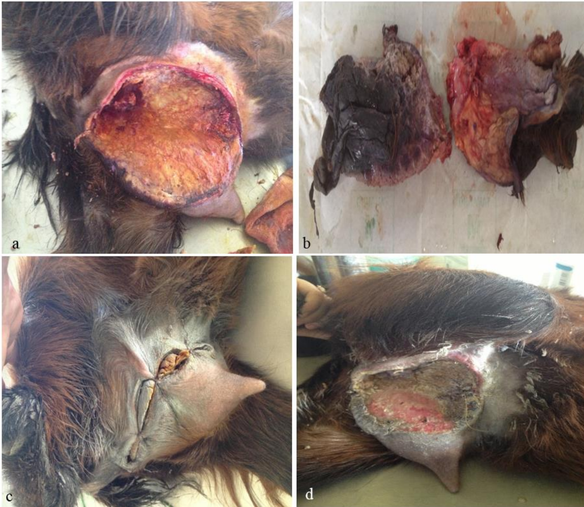
Figura 5: (a) Curetagem química com iodo 2% no pós-cirúrgico, (b) tecido glandular necrosado retirado do úbere direito, (c) fixação de compressa na ferida cirúrgica, (d) aspecto da glândula cinco dias após o procedimento cirúrgico.