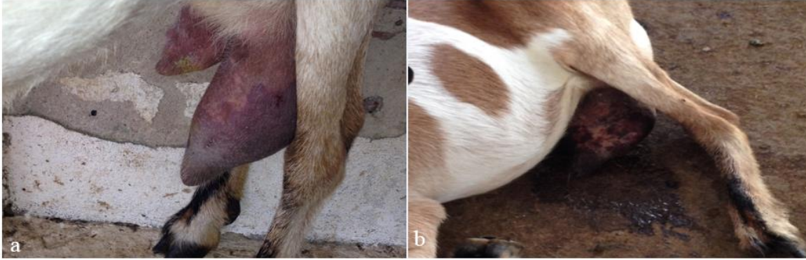
Figura 1: (a) Úbere esquerdo de aspecto cianótico delimitado por linha hiperêmica no dia da chegada do animal no AGA/DMV/UFRPE e (b) úbere apresentando manchas enegrecidas dispostas na região cianótica da glândula e secreção muco-sanguinolenta de coloração enegrecida e fétida cinco dias após a chegada no AGA/DMV/UFRPE.

O animal foi encaminhado ao bloco cirúrgico de grandes animais do Hospital Veterinário do DMV/UFRPE onde procedeu-se a sedação com a administração de cloridrato de xilazina 2% (0,1mg/kg/IV) e analgesia local através de anestesia epidural anterior no espaço lombo-sacro (0,2 ml/kg) e bloqueio local ao redor do úbere (40 mL) com lidocaína 2% sem vasoconstritor. O animal foi colocado em decúbito dorsal e após tricotomia e assepsia ampla do abdome pélvico procedeu-se uma incisão elíptica de padrão uniforme mediante o septo intermamário. A artéria e veia pudenda externa foram isoladas, pinçadas, seccionadas e ligadas para evitar a hemorragia. Durante a cirurgia, o sangramento leve do subcutâneo foi controlado por ligadura com categute cromado (1.0), assim como pontos de drenagem de leite oriundos da parede do septo mamário. Em seguida realizou-se clivagem e ressecção do tecido mamário e do linfonodo supra mamário em monobloco. Para a redução do espaço livre utilizou-se pontos isolados simples com mononylon (0.0) e as margens da pele foram aproximadas com pontos Donatti utilizando fio mononylon (0.0) (Figura 2).