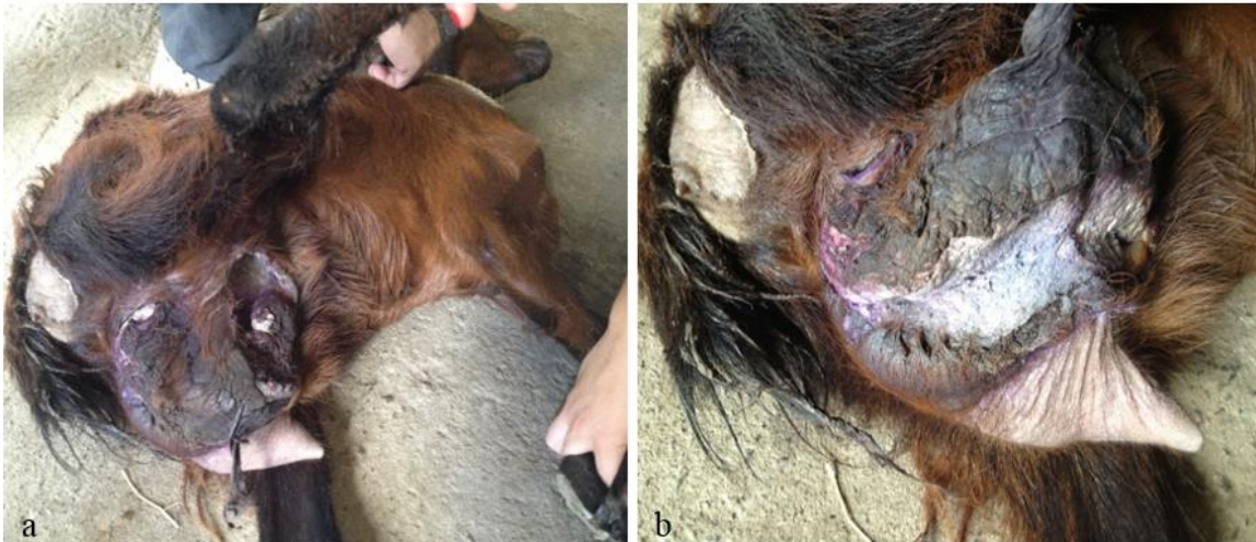
Figura 4: (a) Tecido necrosado, atrofiado, seco de coloração enegrecida no úbere direito e (b) exposição da região do septo glandular do úbere esquerdo.

O exame hematológico revelou leucocitose (18.700/ul) com leve desvio a esquerda regenerativo com presença de 16.269 (87%) segmentados, 2.054/ul (11%) linfócitos, 187/ul (0,1%) bastonetes, 187/ul (0,1%) monócitos 187/ul (0,1%). O fibrinogênio encontrava-se no limite superior (400 g/dl). No coproparazitológico foram encontrados 2.500 ovos da superfamília Trichostrongyloidea além de ovos de Eimeria sp. O resultado foi negativo na tentativa de isolamento bacteriano com amostras de secreções da glândula realizado no Laboratório de Bacterioses dos Animais Domésticos do DMV/UFRPE 3 .