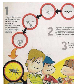
Figura 2: Imagem do ciclo de vida do vetor no início apresentado na Cartilha D.

As cartilhas, em sua maioria, também não foram fiéis quanto à representação dos estágios de forma de vida de imaturos do vetor até chegar à fase adulta. Com exceção das cartilhas A e B, todas apresentaram ciclo de vida incompleto para Aedes aegypti ou não o apresentaram. No caso da cartilha D, a fase de larva foi ilustrada com dois estágios quando, na verdade, deveriam ser quatro (figura 1) ou poderia ser apenas um para ilustrar apenas os principais estágios de desenvolvimento do vetor. Porém, a cartilha F apresentou erro ainda mais grave nesse contexto ao expor um ciclo de vida imatura do vetor com ausência do estágio de pupa. A imagem ainda é acompanhada por texto que indica que as larvas transformam-se em mosquitos adultos, não fazendo nenhuma menção à fase intermediária entre estes dois estágios.