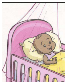
Figura 5: Ilustração de uma das recomendações sugerida na Cartilha F para evitar picadas de mosquito.

Neste contexto, a cartilha F, ao ilustrar como método de prevenção contra a picada do mosquito a utilização de mosquiteiro (figura 4), pode induzir os alunos ao erro visto que na região este utensílio geralmente é usado à noite e, assim, os alunos poderiam associar ao Aedes aegypti hábitos de vida noturnos, característicos do gênero Culex .