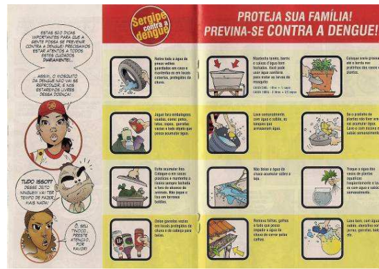
Figura 1: Tipos de criadouros destacados na Cartilha C excluindo tanques de lavar e bebedouros de animais.

A variedade de depósitos utilizados como criadouros está associada às mudanças nos hábitos da população e, também, às medidas de controle adotadas, o que possibilita que as fêmeas oviponham em recipientes como bebedouros de animais [9].